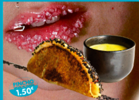
Salamanca del 5 al 14 de junio