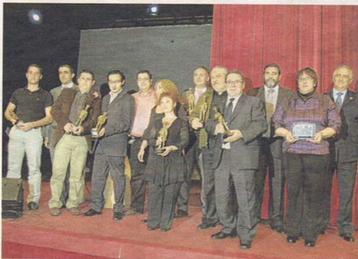
Todos los ganadores de la II Edición de los Premios de Hostelería.