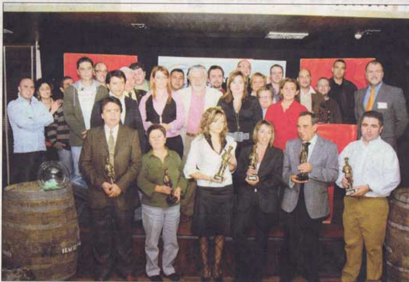
Sobre esta línea, los ganadores de la pasada edición de los premios de hostelería

Además del portal especializado en el sector hostelero, Internacional