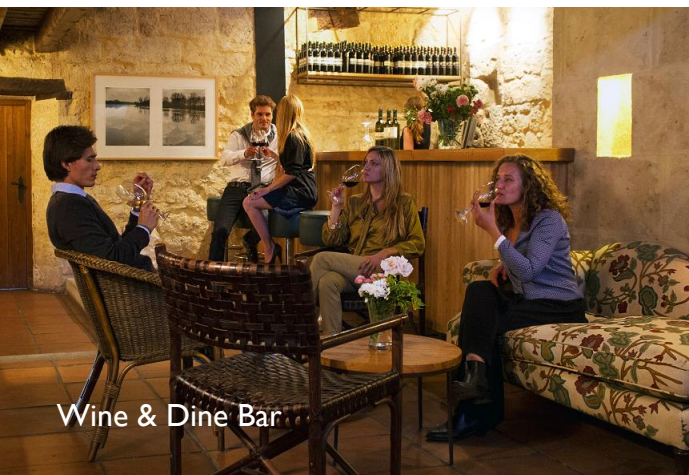
Wine & Dine Bar