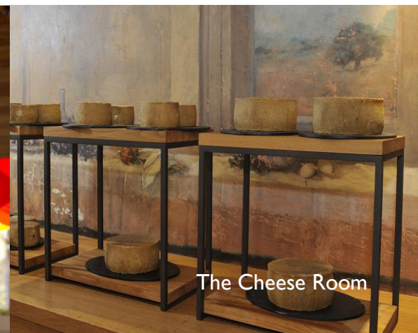
The Cheese Room