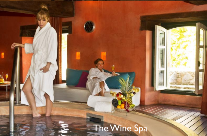
The Wine Spa