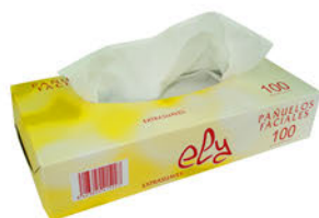
102740 Pañuelos Faciales Ely Extrasuaves Paquete 100 Unid.: 0,89€