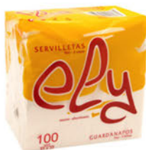
102300 Servilleta Ely 30x30 / Blanco Paquete 100 Unid.: 0,50€