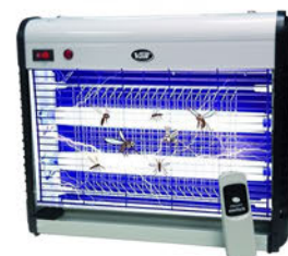
113630 Exterminador de Insectos con Mando 39x30x10 1 Unid.: 96,94€