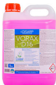
110450 Vorax D16 Desengrasante Garrafa 5L.: 14,75€