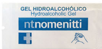
138460 Sobres de Gel Hidroalcohólico Paquete 250 Unid.: 33,35€