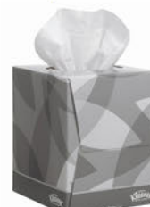
883400 Pañuelos Faciales Kleenex Extrasuaves Paquete 88 Unid.: 2,50€