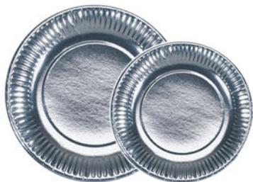
Platos Cartón Plata

para llevar Tortillas o Embutidos Paquete 100 Unid.