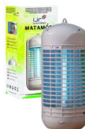
125640 Exterminador de Insectos Policarbonato 13x16x36,5 1 Unid.: 49,76€