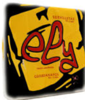
142490 Servilleta Ely 40x40 / Negro Paquete 50 Unid.: 1,64€