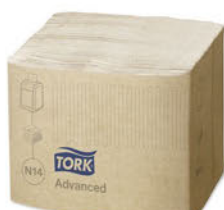
Servilleta Natural para Dispensador