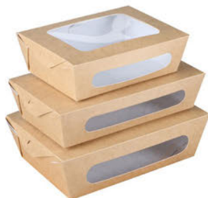
Cajitas Cartón Kraft para Alimentos Fríos