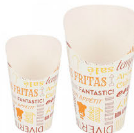
Vaso Cartón Patatas Fritas