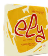
142500 Servilleta Ely 40x40 / Crema o Granate Paquete 50 Unid.: 1,40€