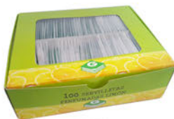
142330 Toallitas Perfumadas Limón Paquete 100 Unid.: 6,22€