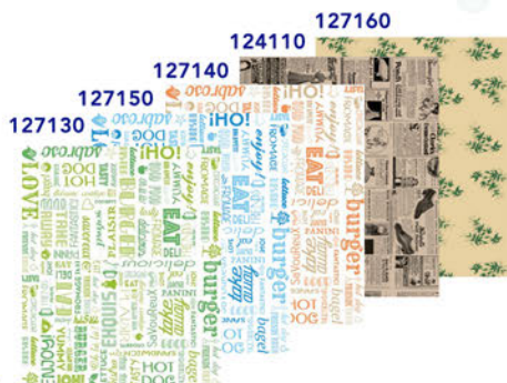
Papeles Antigrasa 28x34

140950 18 cm: 8,27€ / 20 cm: 8,95€ 102490 23 cm: 12,00 € / 25cm: 14,53€