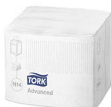
Servilleta Blanca para Dispensador

Caja Servilletas Blanca o Natural de 4320 Unid.: 36,56€