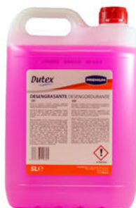
109050 Dutex Desengrasante Garrafa 5L.: 6,75€