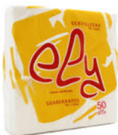
142210 Servilleta Ely 40x40 / Blanco Paquete 50 Unid.: 0,58€